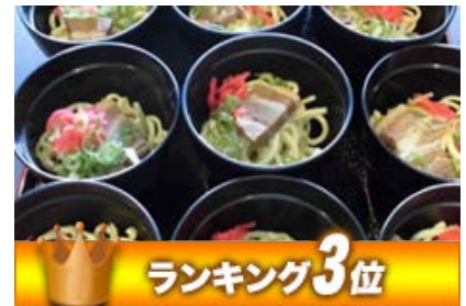
沖縄そば お一人様 300円 (税別)