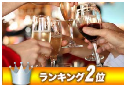
飲み放題 (2時間) お一人様 1,480円 (税別)