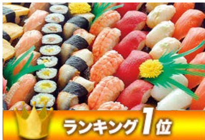
にぎり寿司 一皿50貫 6,000円 (税別)